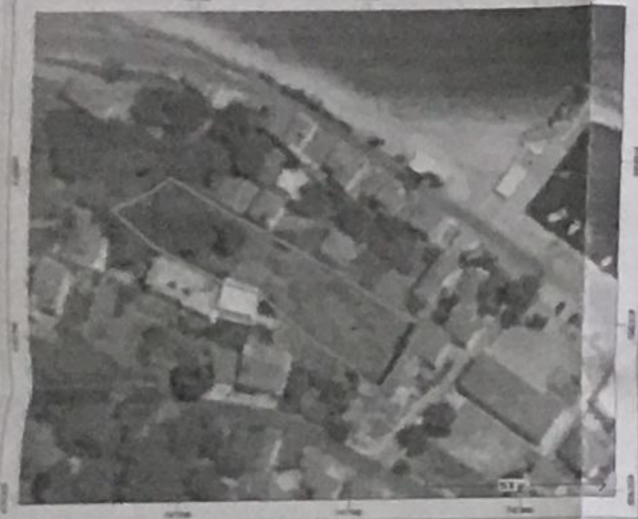
ιδιοκτησία ΠΑΡΑΣΧΟΥ ΚΑΤΡΑΚΑΖΟΣ & ΑΝΑΣΤΑΣΙΑΣ ΓΕΡΑΛΗ