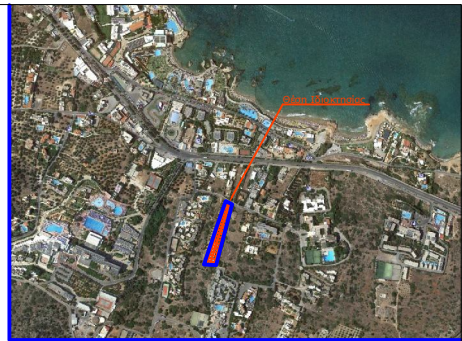
Απόσταση δορυφορικής αρθρογραφίας ευρύτερης περιοχής ιδιοκτησίας