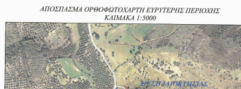
ΑΠΟΣΠΑΣΜΑ ΟΡΘΟΦΩΤΟΓΡΑΦΗ ΕΥΡΥΤΕΡΗΣ ΠΕΡΙΟΧΗΣ ΚΑΙΜΑΚΑ 1:5000