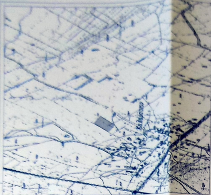
ΧΑΡΤΗΣ ΓΥΣ 1/5000 6232_4