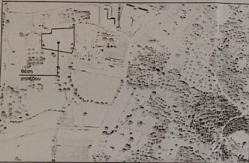
ΑΠΟΣΠΑΣΜΑ ΧΑΡΤΗ - ΕΛΛΗΝΙΚΟ ΚΤΗΜΑΤΟΛΟΓΙΟ