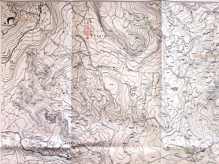
ΑΠΟΤΥΠΩΜΑ ΚΑΡΤΗΣ Γ.Υ.Σ. (4011/7) Κ.Α. 1:8000 ΠΕΡΙΟΧΗΣ ΟΙΚΙΣΜΟΥ ΚΑΒΑΛΑΣ Κ.Ε. ΠΛΑΚΗΣ ΔΗΜΟΥ ΚΡΑΒΑΡΩΝΑΣ