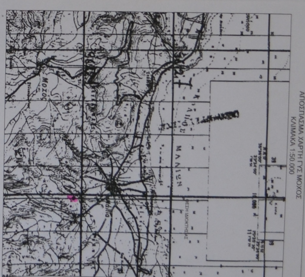
ΑΠΟΪΣΤΑΣΜΑ ΧΑΡΤΗ ΓΥΣ ΜΟΖΟΣ ΚΑΙΜΑΚΑ 1:50.000

ΕΜΒΑΔΟΝ ΙΔΙΟΚΤΗΣΙΑΣ (1-2-3-4-5-6-7-8-9-10-11)-525,84 μ² Η ΠΡΩΤΗ ΕΠΙΧΕΙΡΗΣΙΑΚΗ ΜΕΛΕΤΗ ΤΗΣ ΚΑΤΑΣΤΑΣΗΣ ΤΗΣ ΠΕΡΙΦΕΡΕΙΑΣ ΚΡΗΤΗΣ