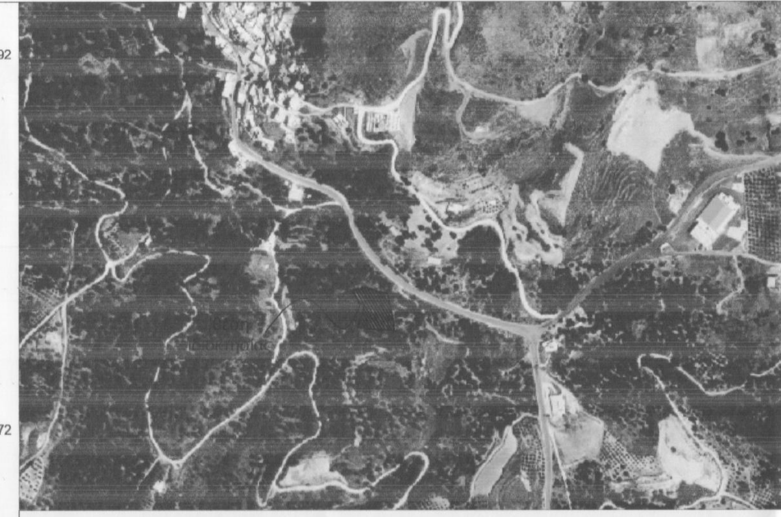
Απόσπασμα ορθοφωτοχάρτη ευρύτερης περιοχής κλίμακα 1:5000