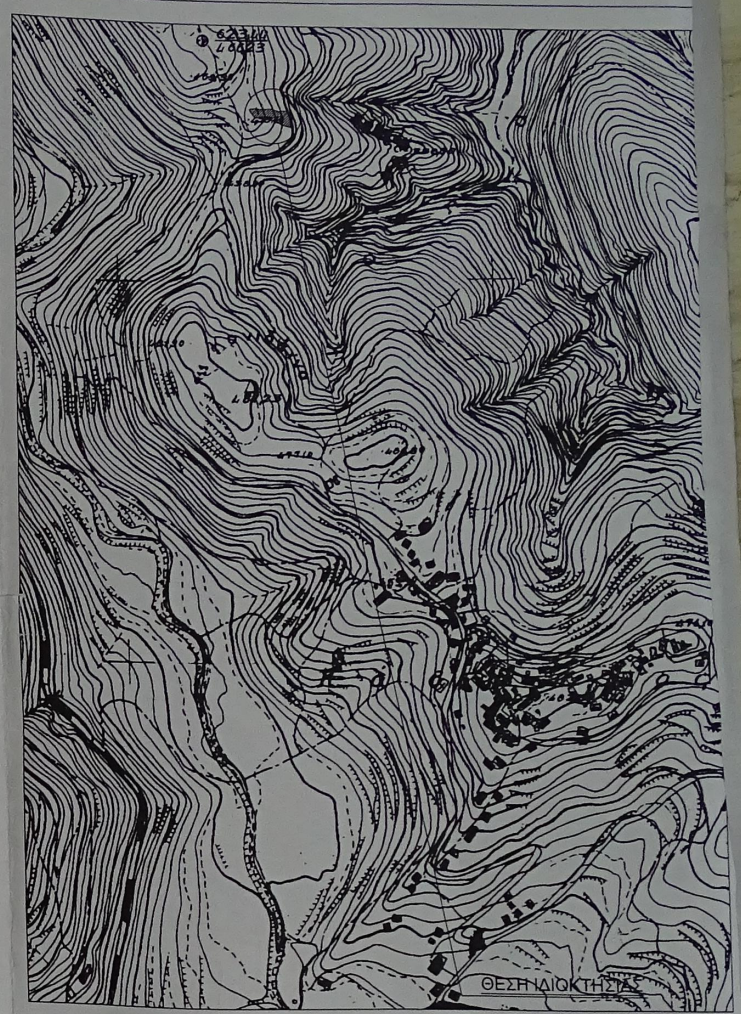
ΑΠΟΣΠΑΣΜΑ ΧΑΡΤΗ Γ.Υ.Σ (5174/1) ΚΛΙΜΑΚΑ 1:10000