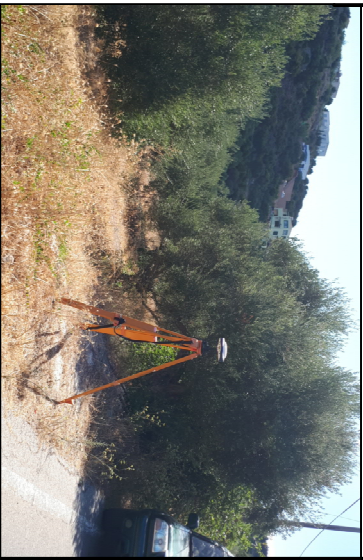
ΦΩΤΟΓΡΑΦΙΑ ΟΙ ΑΚΙΝΗΤΟΥ