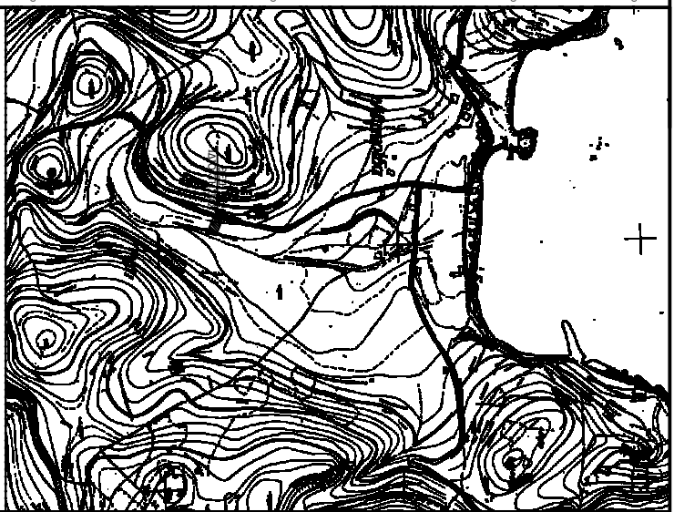
ΑΠΟΤΥΠΩΣΜΑ ΧΑΡΤΗ ΠΕΡΙΟΧΗΣ ΚΙΜΑΚΑΣ 1:5000