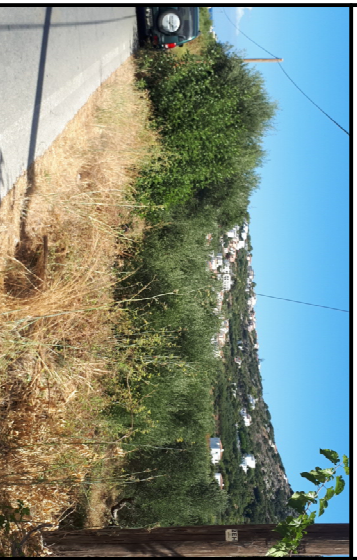
ΦΩΤΟΓΡΑΦΙΑ Ο2 ΑΚΙΝΗΤΟΥ