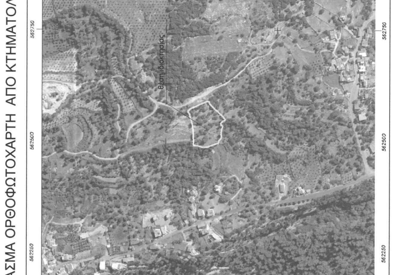
ΑΠΟΤΥΠΩΣΗ ΟΡΘΟΦΩΤΟΧΑΡΤΗ ΑΠΟ ΚΤΗΜΑΤΟΛΟΓΟ Α.Ε.

ΕΠΙΛΟΓΗ ΣΥΜΒΟΥΛΩΝ Ο ΣΥΜΒΟΥΛΟΣ ΠΟΛΙΤΙΚΩΝ ΜΗΧΑΝΙΚΩΣ Τ.Ε. ΠΡΟΤΥΠΟΥΣ ΤΕΧΝΟΛΟΓΙΑΣ ΚΑΙ ΕΡΕΥΝΑΣ Διεύθυνση: ΠΑΡΑΡΤΗΜΑΤΟΣ ΠΟΛΙΤΙΚΩΝ ΜΗΧΑΝΙΚΩΣ Τ.Ε. Ομοσπονδίας Πολιτικών Μηχανικών Ελλάδος Τηλεφωνικό Κέντρο: 210 7723000 Τηλεfax: 210 7723001 E-mail: info@tpm.gr Web: www.tpm.gr ΕΠΙΛΟΓΗ ΣΥΜΒΟΥΛΩΝ Ο ΣΥΜΒΟΥΛΟΣ ΠΟΛΙΤΙΚΩΝ ΜΗΧΑΝΙΚΩΣ Τ.Ε. ΠΡΟΤΥΠΟΥΣ ΤΕΧΝΟΛΟΓΙΑΣ ΚΑΙ ΕΡΕΥΝΑΣ Διεύθυνση: ΠΑΡΑΡΤΗΜΑΤΟΣ ΠΟΛΙΤΙΚΩΝ ΜΗΧΑΝΙΚΩΣ Τ.Ε. Ομοσπονδίας Πολιτικών Μηχανικών Ελλάδος Τηλεφωνικό Κέντρο: 210 7723000 Τηλεfax: 210 7723001 E-mail: info@tpm.gr Web: www.tpm.gr ΕΠΙΛΟΓΗ ΣΥΜΒΟΥΛΩΝ Ο ΣΥΜΒΟΥΛΟΣ ΠΟΛΙΤΙΚΩΝ ΜΗΧΑΝΙΚΩΣ Τ.Ε. ΠΡΟΤΥΠΟΥΣ ΤΕΧΝΟΛΟΓΙΑΣ ΚΑΙ ΕΡΕΥΝΑΣ Διεύθυνση: ΠΑΡΑΡΤΗΜΑΤΟΣ ΠΟΛΙΤΙΚΩΝ ΜΗΧΑΝΙΚΩΣ Τ.Ε. Ομοσπονδίας Πολιτικών Μηχανικών Ελλάδος Τηλεφωνικό Κέντρο: 210 7723000 Τηλεfax: 210 7723001 E-mail: info@tpm.gr Web: www.tpm.gr