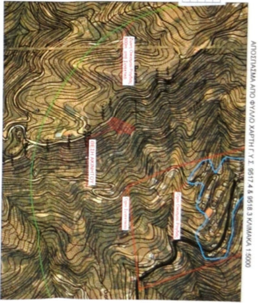
ΑΠΟΤΥΠΩΣΗ ΑΠΟ ΦΩΤΟ ΑΕΡΙΑΣ Γ.Υ. 9617 4.8 9618 3 ΚΑΜΑΚΑ 1:500

Ο σχεδιασμός και η οργάνωση του έργου βασίστηκε στα στοιχεία που παρέχονται στο σχέδιο και στην κλίμακα 1:500. Η μελέτη πραγματοποιήθηκε με τη βοήθεια των δεδομένων που παρέχονται στο σχέδιο και στην κλίμακα 1:500. Η μελέτη πραγματοποιήθηκε με τη βοήθεια των δεδομένων που παρέχονται στο σχέδιο και στην κλίμακα 1:500.