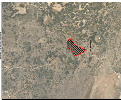
Αεροφωτογραφία του τοπίου