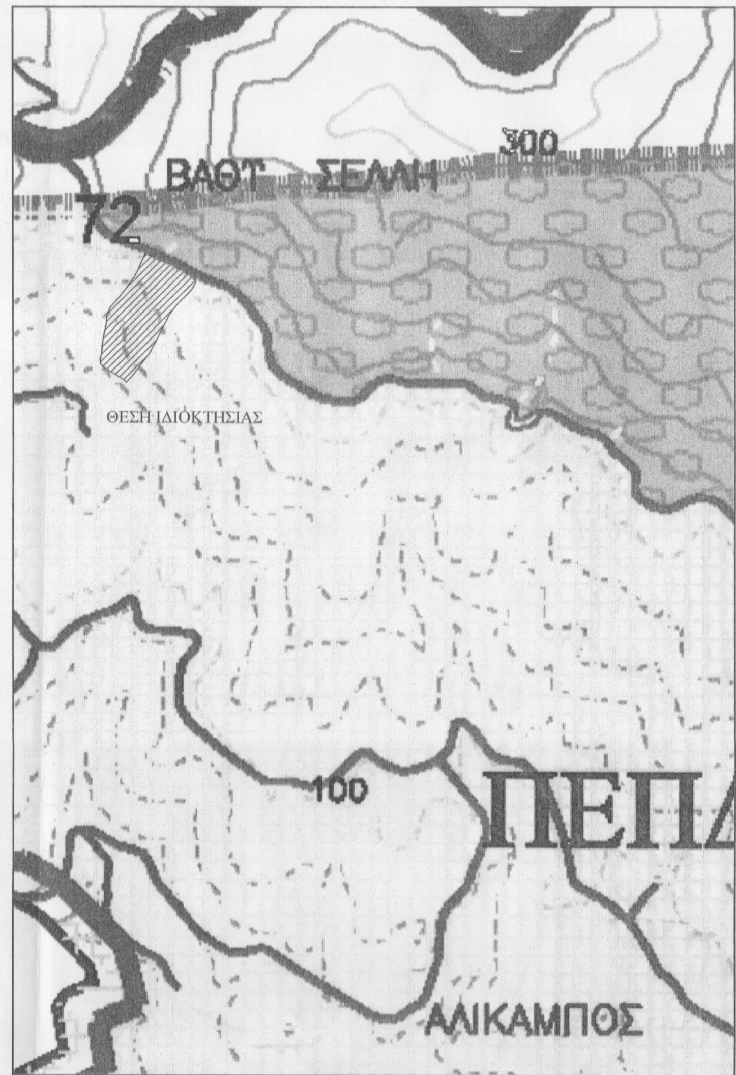
ΑΠΟΣΠΑΣΜΑ ΧΑΡΤΗ ΚΑΙΜΑΚΑ 1:5000