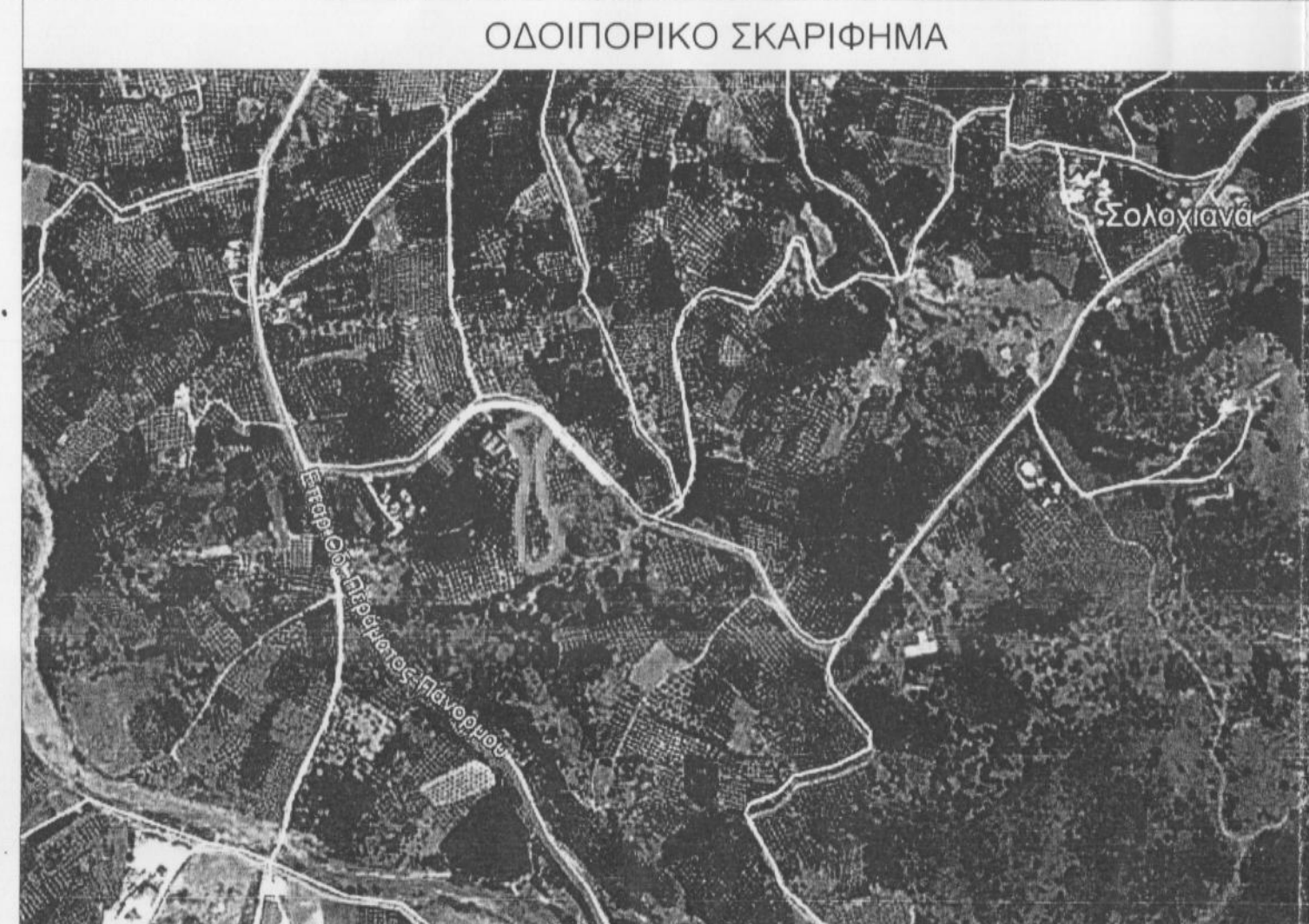
ΑΠΟΣΠΑΣΜΑ ΧΑΡΤΗ ΚΛΙΜΑΚΑ 1:5000 (αρ.φύλλου 95134) ΘΕΣΗ ΓΕΩΤΕΜΑΧΙΟΥ

ΕΜΒΑΔΩΝ ΓΕΩΤΕΜΑΧΙΟΥ E 1-2-3-4-5-6-7-8-9-10-11-12-13-14-15-16-17-18-19-20-21-22-23-24-25-26-27-28-29-30-31-32-33-34-35-36-37-38-1 = 6265,61τ.μ. το διάγραμμα είναι ενταγμένο στο κρατικό σύστημα συντεταγμένων ΕΓΣΑ '87 οι διαστάσεις και τα εμβαδά υπολογίστηκαν αναλυτικά από τις συντεταγμένες των κορυφών η μέτρηση έγινε με γεωδαιτικό GPS σταθμό Leica Viva GNSS και η εξάρτηση σε ΕΓΣΑ '87 έγινε από το HEPOS για την εξάρτηση υπογράφει η Μανωλίτση Γεωργία ΓΕΩΡΓΙΑ ΕΥΑΓΓ. ΜΑΝΩΛΙΤΣΗ ΠΟΛΙΤΙΚΟΣ ΜΗΧΑΝΙΚΟΣ Δ.Π.Θ. Μ.Μ.Σ. Α.Φ.Μ. 131324776 ΔΟΥ Ρεθύμνου