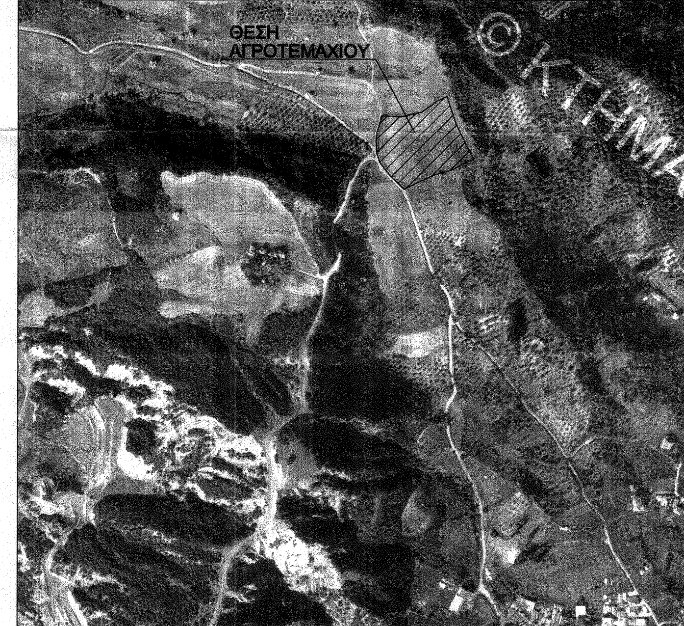
ΑΠΟΣΠΑΣΜΑ ΟΡΘΟΦΩΤΟΧΑΡΤΗ ΚΤΗΜΑΤΟΛΟΓΙΟΥ ΚΛΙΜΑΚΑΣ 1:5.000