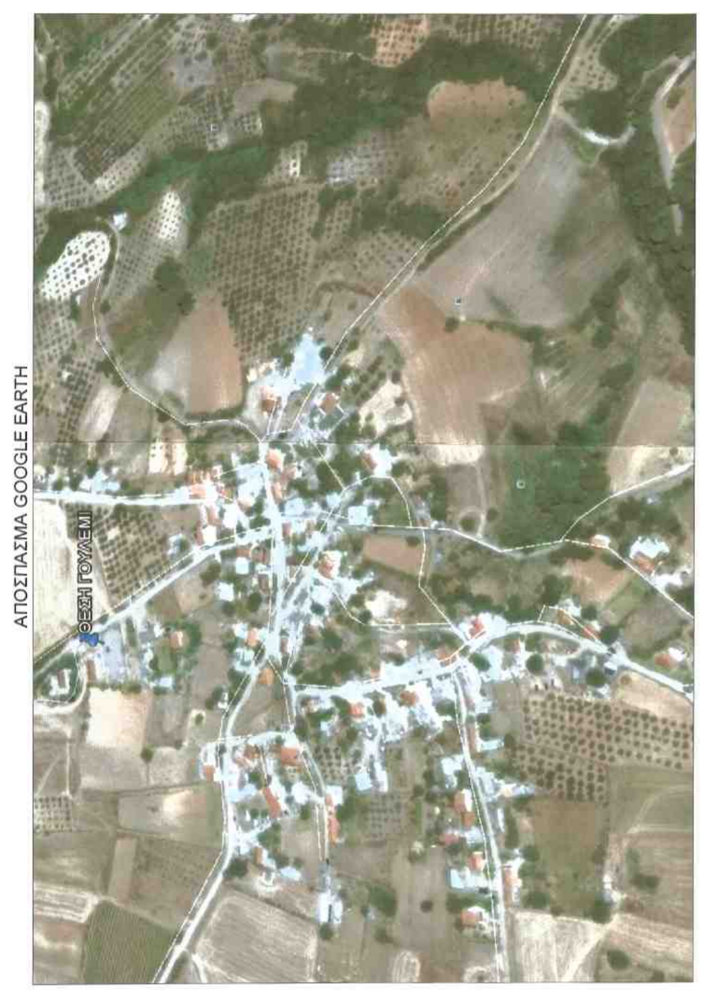
ΑΠΟΣΠΑΣΜΑ GOOGLE EARTH