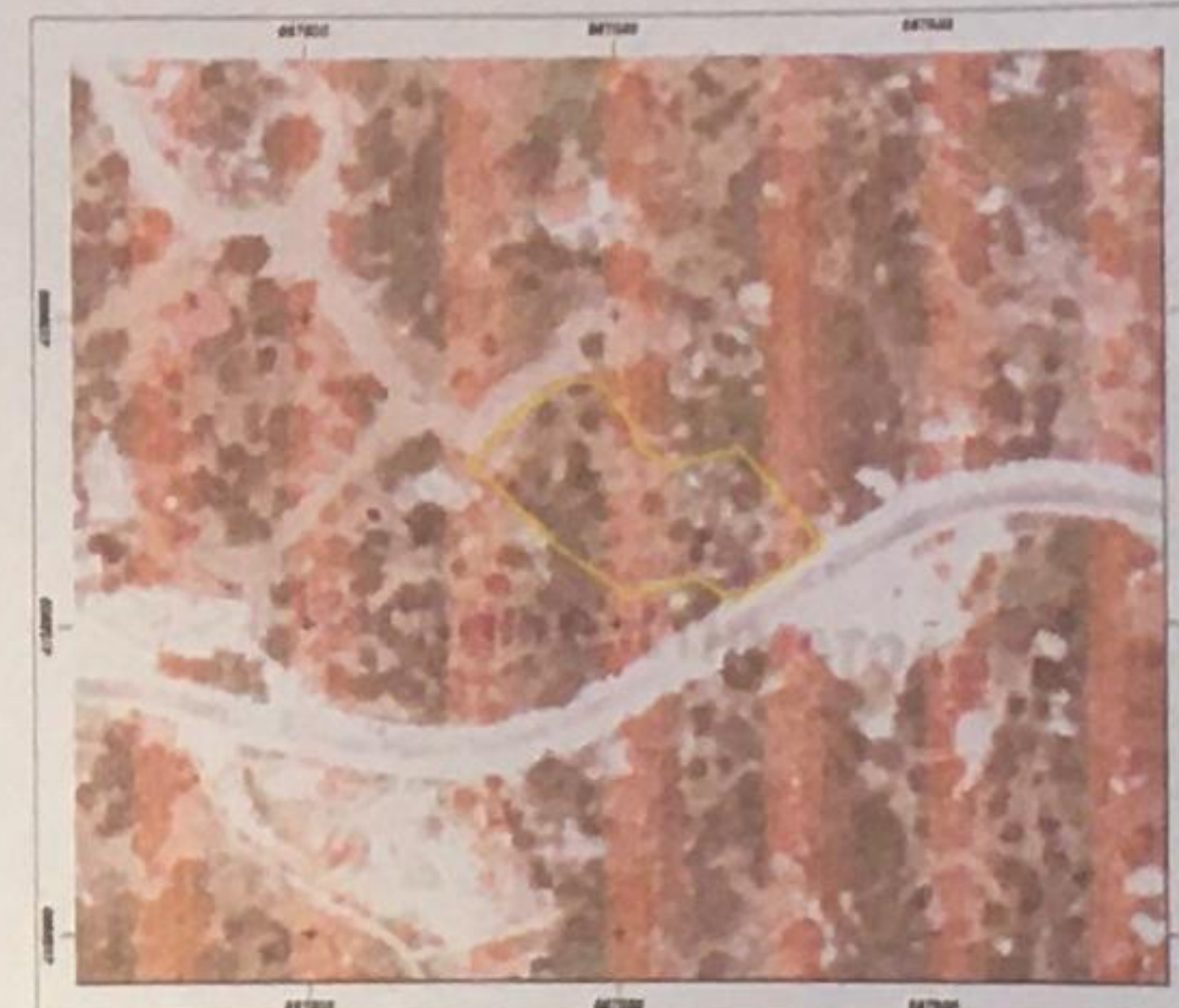
Πίνακας Συντεταγμένων των κορυφών του Α,Β,Γ..... Εμβαδόν τεμαχίου = 1068.88 τ.μ. - Περίμετρος = 146.03 μ.