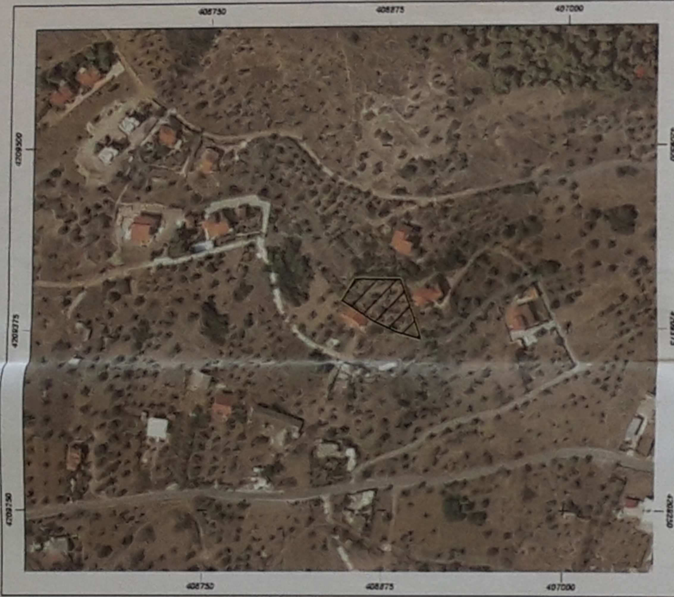
ΑΠΟΣΠΑΣΜΑ ΟΡΘΟΦΩΤΟΧΑΡΤΗ ΑΠΟ ΚΤΗΜΑΤΟΛΟΓΙΟ ΑΕ