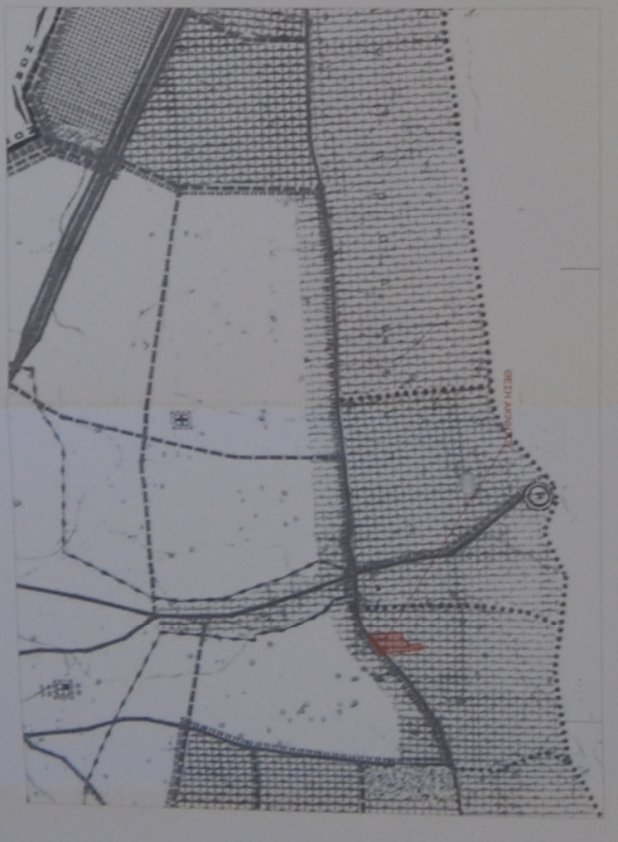
ΑΝΤΙΣΤΑΣΙΑ ΧΑΡΤΗ Γ.Σ. ΜΑΚΡΟΝ ΚΑΜΑΚΩΝ 1:5000