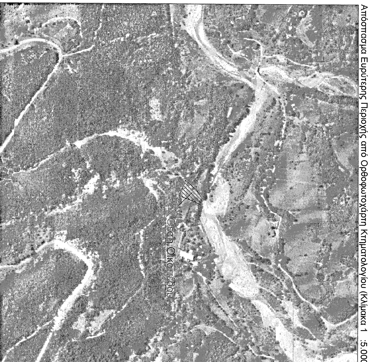
Αποσπασμα Εμπύρεσης Περιοχής από Οδοφωτοχάρτη Κτηματολογίου (Κλίμακα 1 : 5.000)