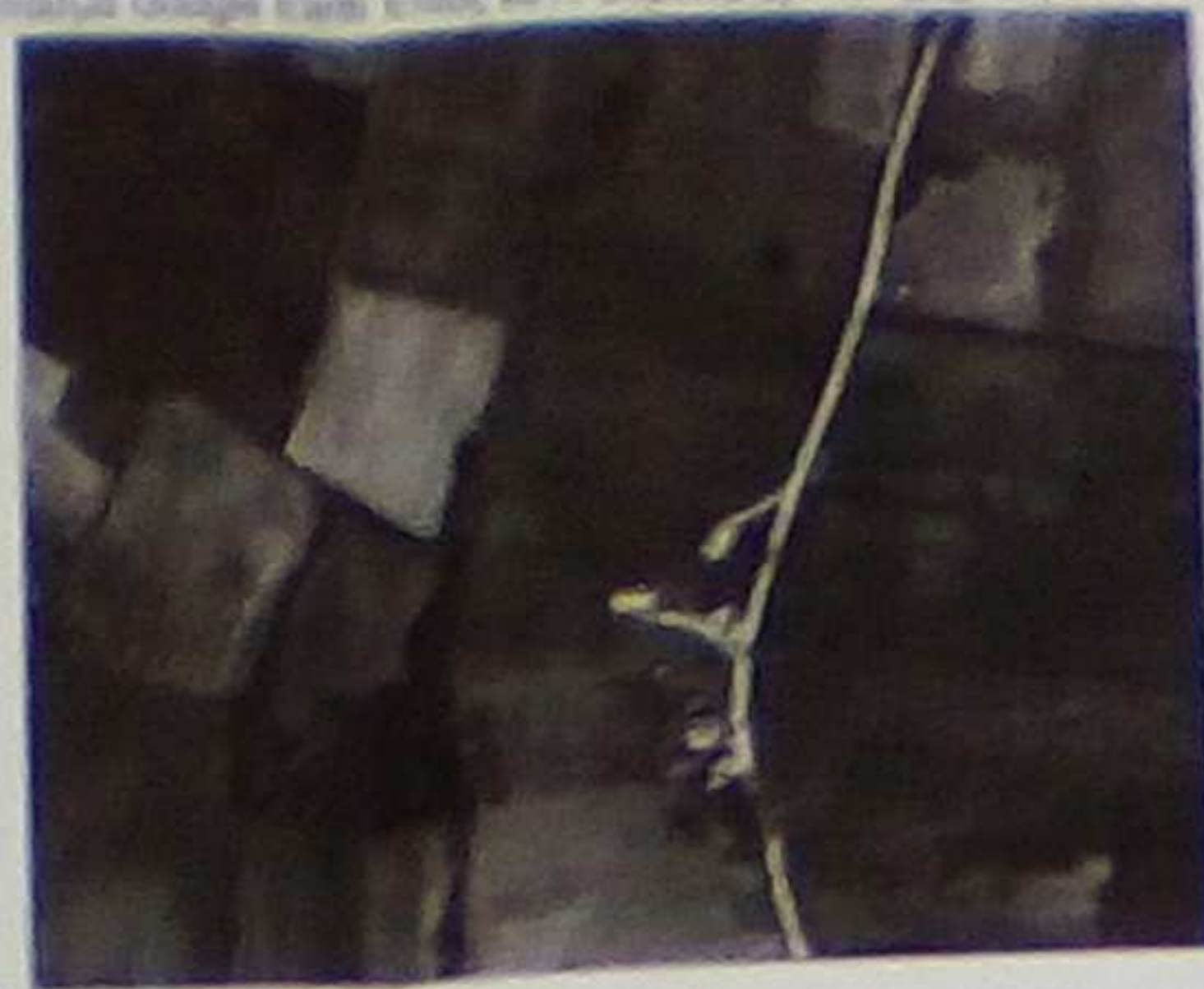
Αντικείμενο Google Earth Έτος 2017 Ενότητα Τοπογραφία Κλίμακα 1:5000