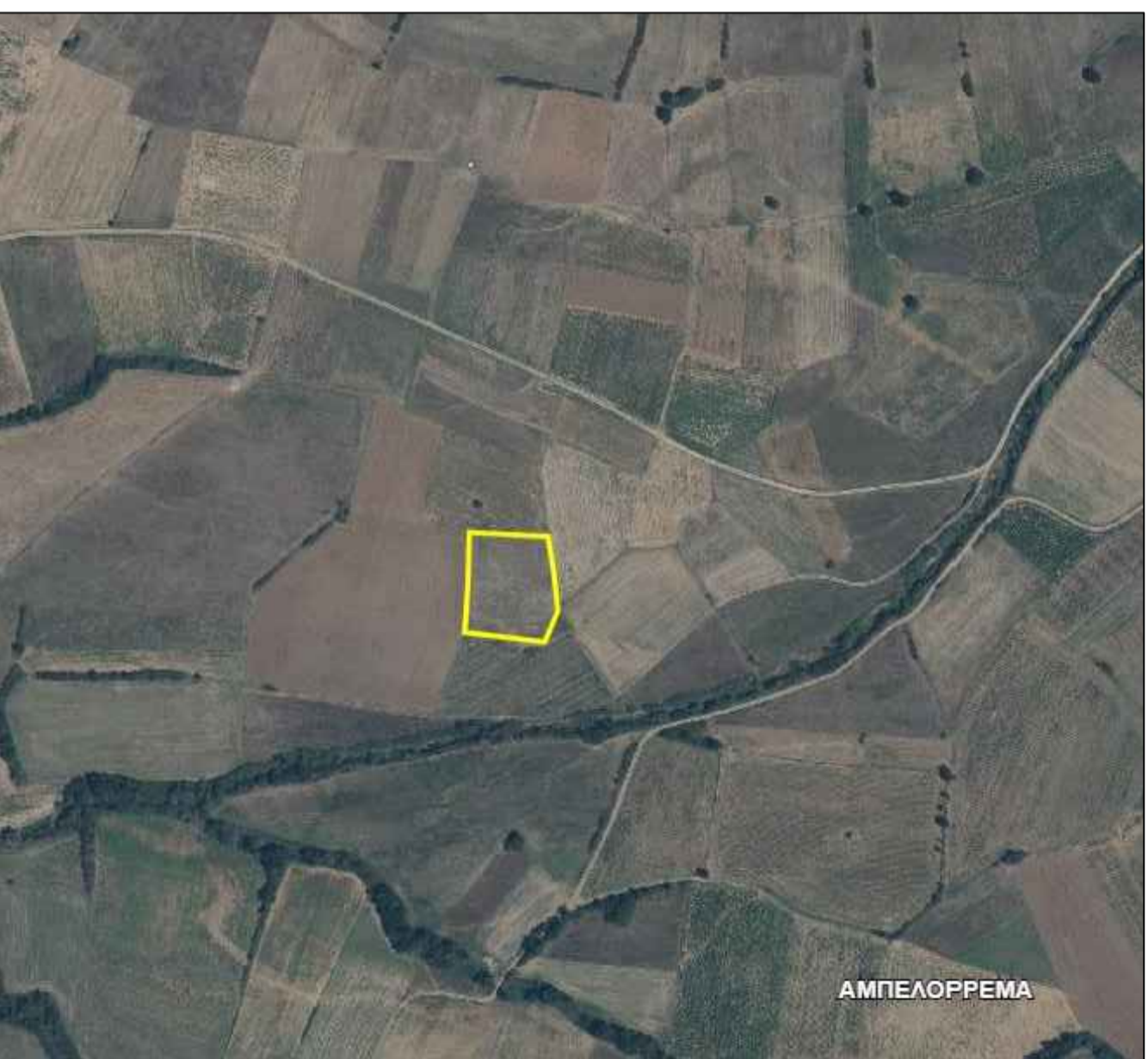
ΑΠΟΣΠΑΣΜΑ ΕΥΡΥΤΕΡΗΣ ΠΕΡΙΟΧΗΣ - ΘΕΣΗ ΑΓΡΟΤ/ΧΙΟΥ