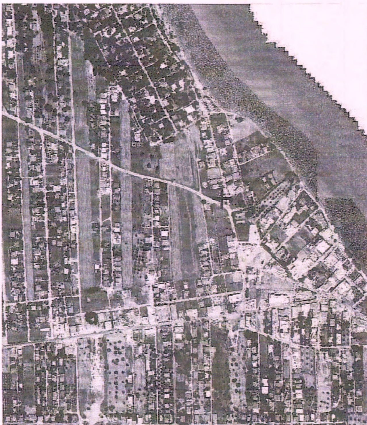
ΑΠΟΣΤΑΣΜΑ ΧΑΡΤΗ ΚΛΙΜΑΚΑ 1:5000