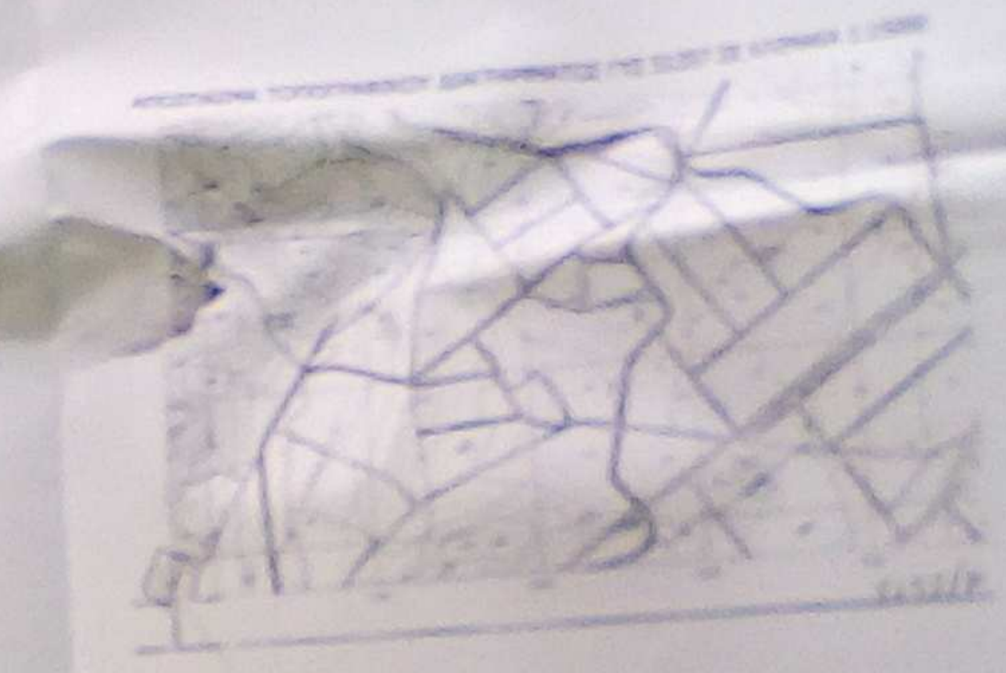
ΠΡΩΤΟ ΣΧΕΔΙΟ ΚΑΤΑΣΤΑΣΗΣ ΜΕΛΕΤΗΣ

ΑΥΞΙΣΤΑΣΙΑ ΚΑΤΑΣΤΑΣΗΣ ΜΕΛΕΤΗΣ ΣΤΟΙΧ 1:5000 Η κατασκευή του κτιρίου θα γίνει σύμφωνα με το σχέδιο που επισυνάπτεται με την παρούσα έκθεση. Η κατασκευή του κτιρίου θα γίνει σύμφωνα με το σχέδιο που επισυνάπτεται με την παρούσα έκθεση.