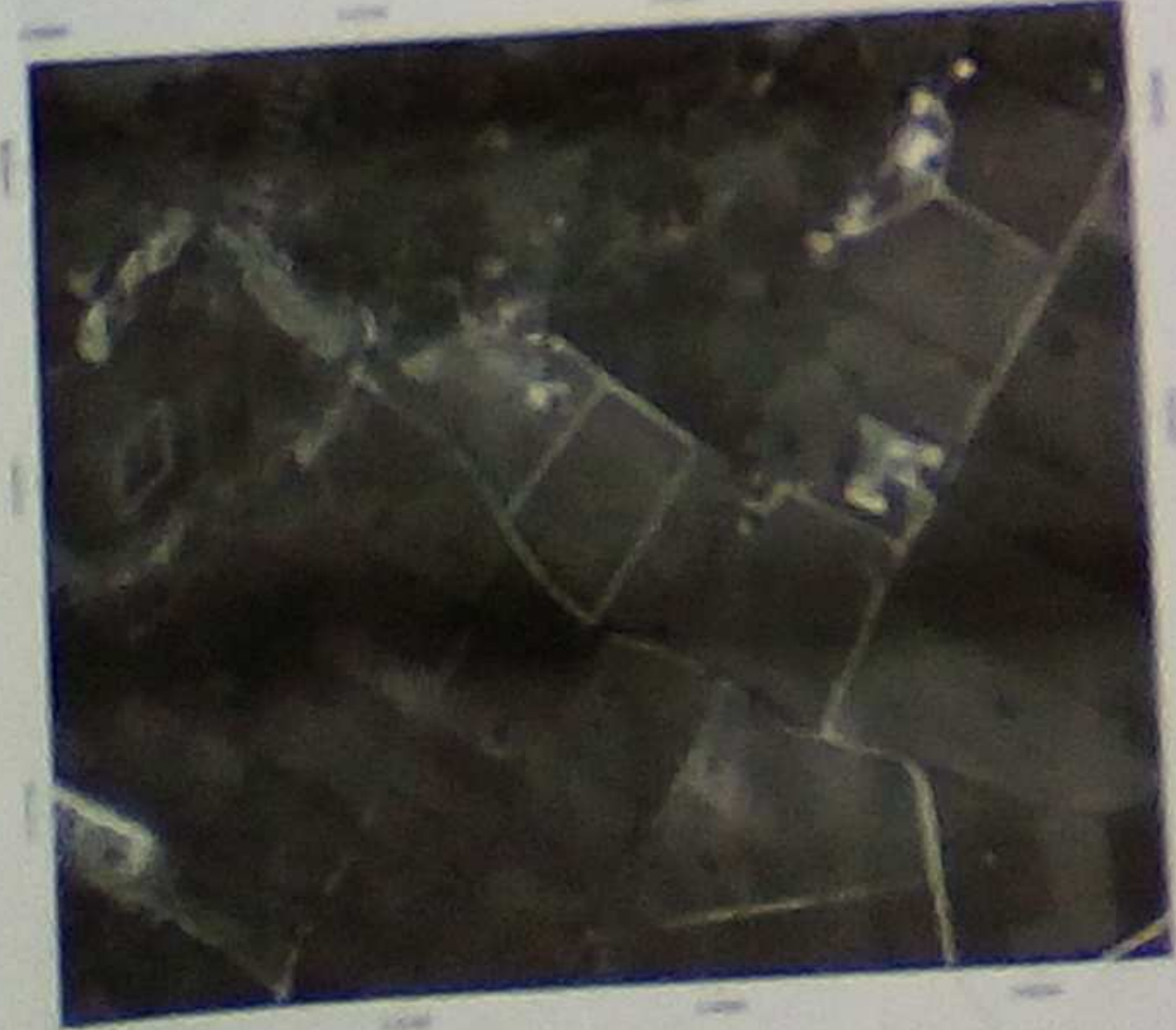
ΠΡΩΤΟ ΣΧΕΔΙΟ ΚΑΤΑΣΤΑΣΗΣ ΜΕΛΕΤΗΣ