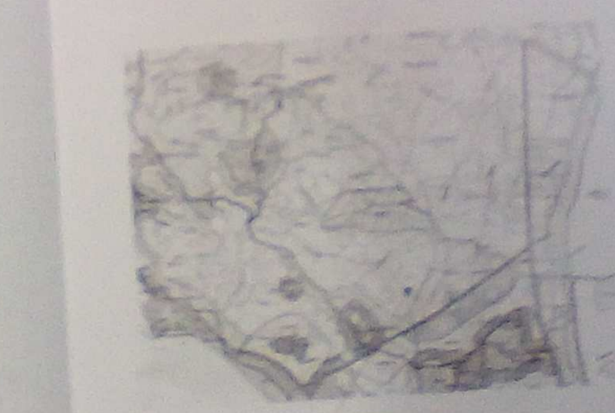
ΠΡΩΤΟ ΣΧΕΔΙΟ ΚΑΤΑΣΤΑΣΗΣ ΜΕΛΕΤΗΣ

ΑΥΞΙΣΤΑΣΙΑ ΚΑΤΑΣΤΑΣΗΣ ΜΕΛΕΤΗΣ ΣΤΟΙΧ 1:5000 Η κατασκευή του κτιρίου θα γίνει σύμφωνα με το σχέδιο που επισυνάπτεται με την παρούσα έκθεση. Η κατασκευή του κτιρίου θα γίνει σύμφωνα με το σχέδιο που επισυνάπτεται με την παρούσα έκθεση.