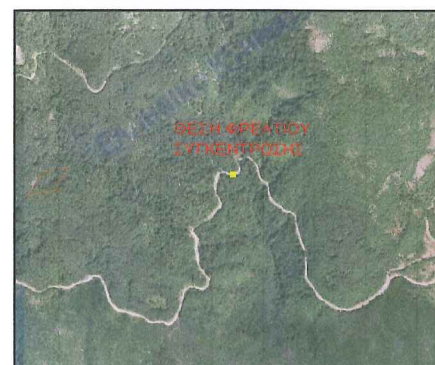
ΑΠΟΣΠΑΣΜΑ ΟΡΘΟΦΩΤΟΧΑΡΤΗ