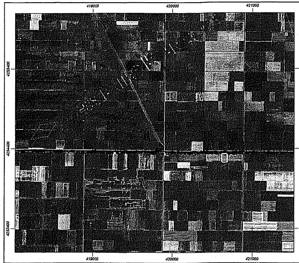
ΑΠΟΣΠΑΣΜΑ ΧΑΡΤΗ Γ.Υ.Σ. ΑΡ. ΦΥΛΛΟΥ 6308/6 ΚΛ. 1:5000