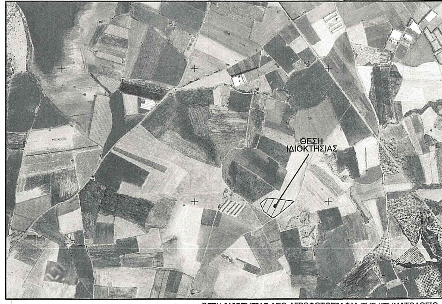
ΘΕΣΗ ΙΔΙΟΤΗΣΙΑΣ ΑΠΟ ΑΕΡΟΦΩΤΟΓΡΑΦΙΑ ΤΗΣ ΚΤΗΜΑΤΟΛΟΓΙΟ Α.Ε.

ΟΡΟΙ ΔΟΜΗΣΗΣ ΕΚΤΟΣ ΟΡΙΩΝ ΟΙΚΙΣΜΟΥ (Π.Δ. 24.05.1985 - ΦΕΚ 270δ / 31.05.1985 & Ν. 3212 - ΦΕΚ 308Α / 31.12.2003) Αρτιότητα κατά κανόνα: (για πρόσωπο σε κοινόχρηστο δρόμο) Εμβαδόν = 4000τμ - Πρόσωπο = 25.00μ (για πρόσωπο σε Διεθνείς, Εθνικές, Επαρχιακές, Δημοτικές και Κοινοτικές οδούς ως και σε εγκαταλεημένα τμήματά τους και σε σιδηροδρομικές γραμμές) Εμβαδόν = 4000τμ - Πρόσωπο = 45.00μ - Βάθος = 50.00μ Αρτιότητα κατά παρέκκλιση: (χωρίς πρόσωπο σε δρόμο) Εμβαδόν = 4000τμ (προ 31.12.2003) (για πρόσωπο σε Διεθνείς, Εθνικές, Επαρχιακές, Δημοτικές και Κοινοτικές οδούς ως και σε εγκαταλεημένα τμήματά τους και σε σιδηροδρομικές γραμμές) Εμβαδόν = 2000τμ - Πρόσωπο = 25.00μ - Βάθος = 40.00μ (προ 17.10.1978) Εμβαδόν = 1200τμ - Πρόσωπο = 20.00μ - Βάθος = 35.00μ (προ 12.09.1964) Εμβαδόν = 750τμ - Πρόσωπο = 10.00μ - Βάθος = 15.00μ (προ 12.11.1952) (εντός της ζώνης πόλεων και οικισμών & προ 24.04.1977) Εμβαδόν = 2000τμ