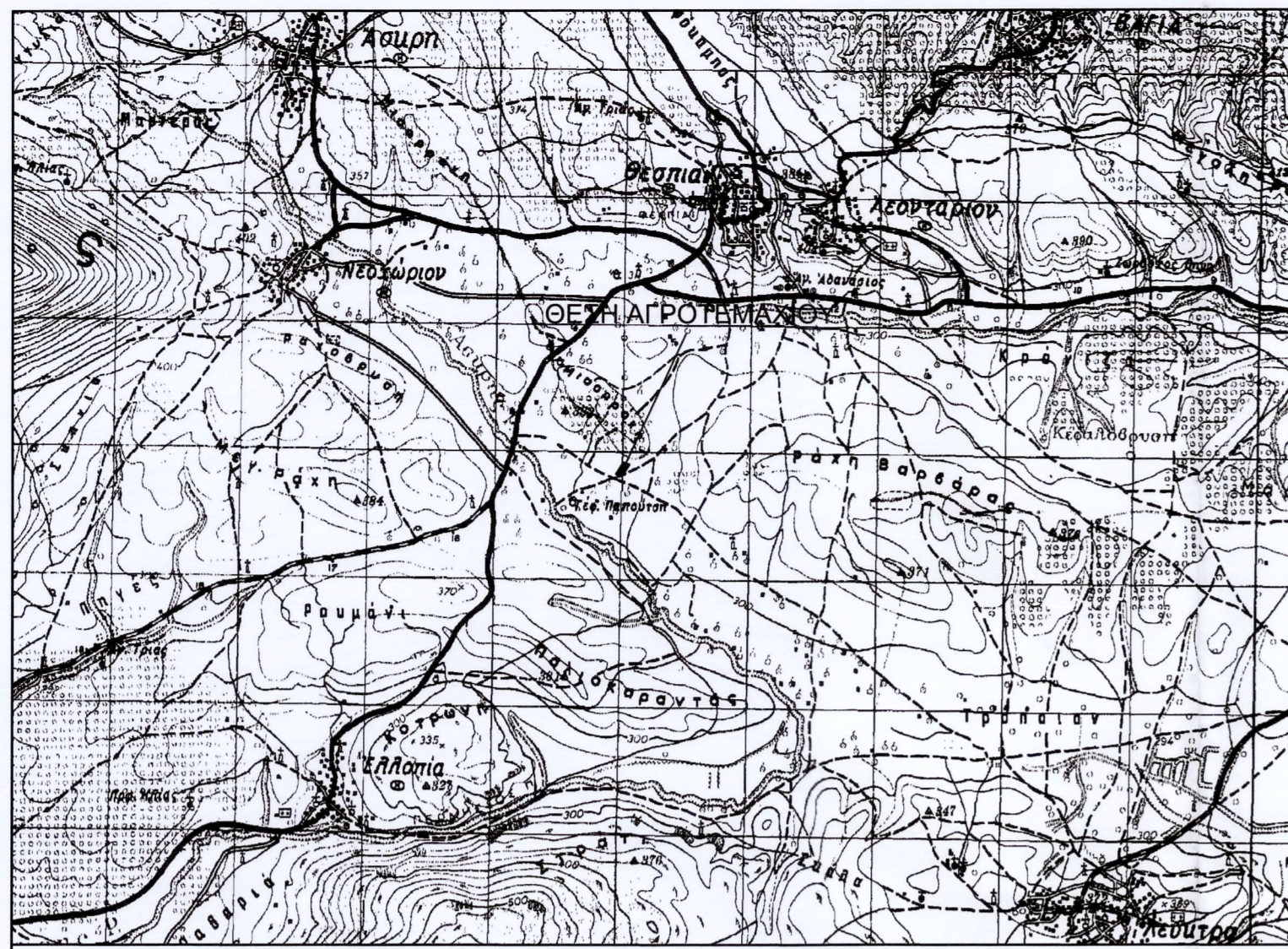
ΑΠΟΣΠΑΣΜΑ ΦΥΛΛΟΥ ΧΑΡΤΗ ΒΑΓΙΑ - ΚΛΙΜΑΚΑ 1:50.000