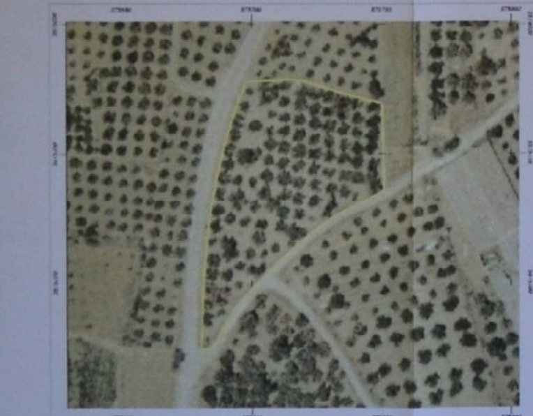
Θέση ιδιοκτησίας σε απόσπασμα ΕΚΚΑ, Κλίμακα 1:1.000.