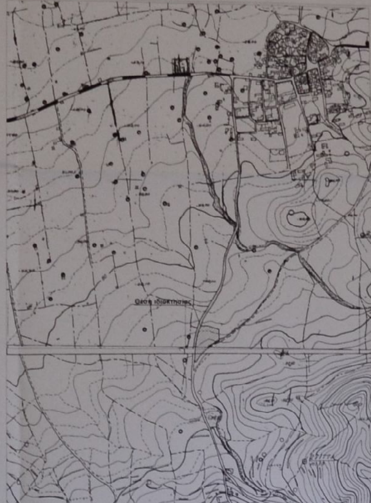
Θέση ιδιοκτησίας σε απόσπασμα φύλλων χάρτη Γ.Υ.Σ. (9546, 5 και 9546, 7), Κλίμακα 1 : 5.000.