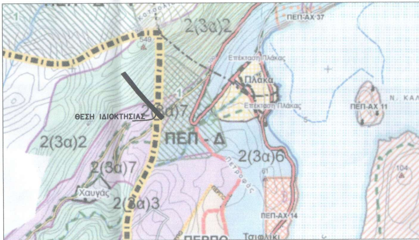
ΑΠΟΣΠΑΣΜΑ ΣΧΟΑΠ ΑΓΙΟΥ ΝΙΚΟΛΑΟΥ (ΚΛΙΜΑΚΑ 1:25.000)