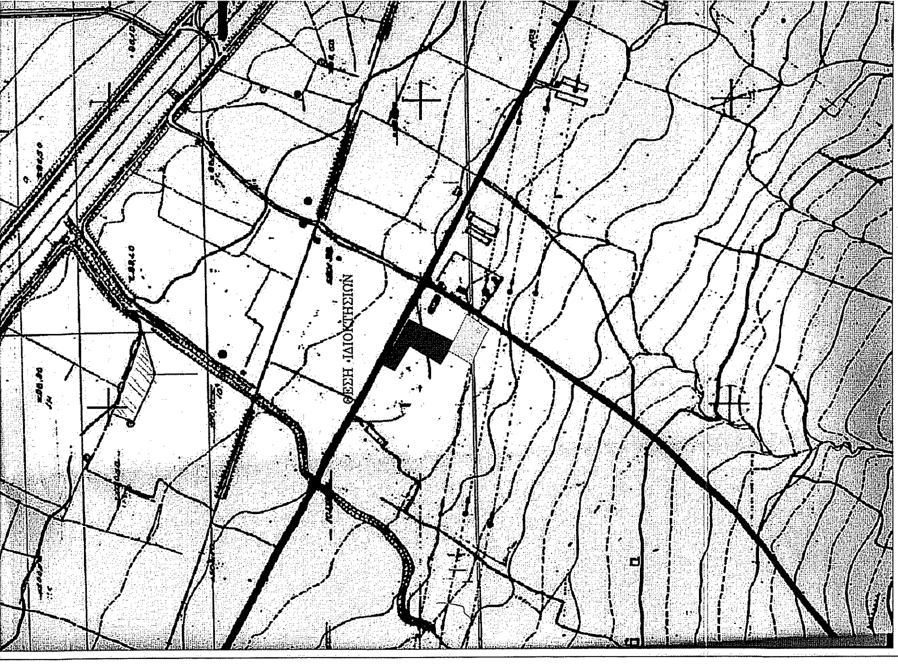
ΑΠΟΣΠΑΣΜΑ ΧΑΡΤΗ Γ.Υ.Σ. αρ.φ. 6318/1 κλίμακα 1:5000