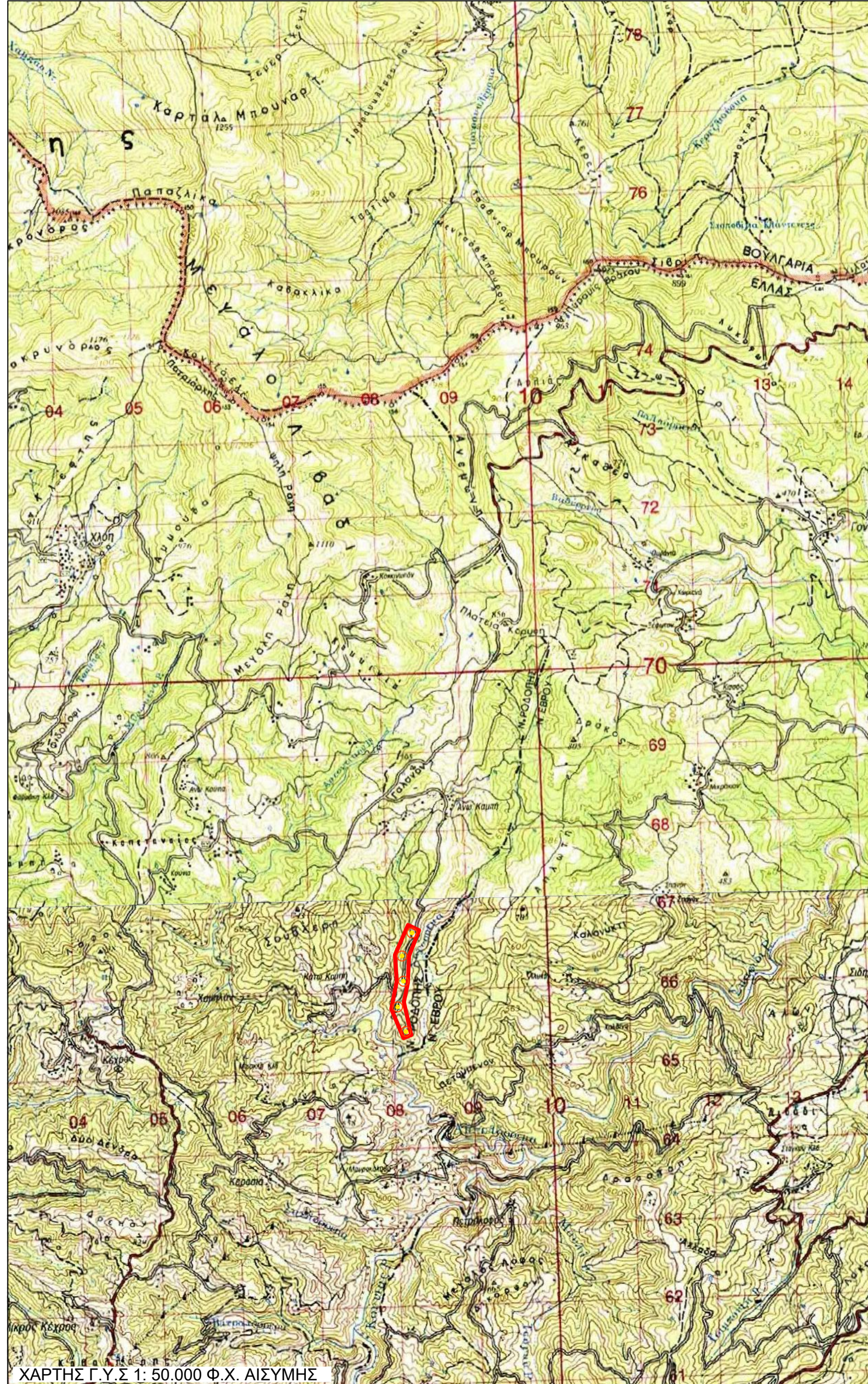
ΧΑΡΤΗΣ Γ.Υ.Σ. 1:50.000 Φ.Χ. ΑΙΣΥΜΗΣ