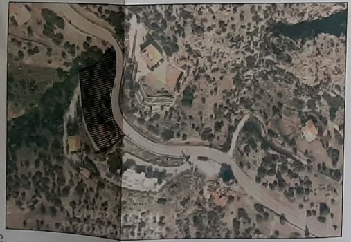
ΑΠΟΣΠΑΣΜΑ ΟΡΘΟΦΩΤΟΧΑΡΤΗ (404-4206)

ΘΕΣΗ "ΚΟΚΚΙΝΟΣ ΒΡΑΧΟΣ" ΔΗΜΟΥ ΛΟΥΤΡΑΚΙΟΥ-ΑΓ. ΘΕΟΔ. 1. ΟΡΟΙ ΔΟΜΗΣΗΣ Π.Δ. 24/31.05.1985 - Φ.Ε.Κ. 270 Δ', Ν. 3212 - ΦΕΚ308Α/ 31.12.2003 • Αρτιότητα: 4.000 τ.μ. (άρθρο 10 παρ. 1α ΦΕΚ308Α) Π=25μ (άρθρο 10 παρ. 1α ΦΕΚ308Α) • Κάλυψη: 10% (άρθρο 1 παρ. 3) • Αριθμός ορόφων: 2 (άρθρο 1 παρ. 7) • Συντελεστής δόμησης: 0,20 (άρθρο 1 παρ. 6) • Πλάγιες αποστάσεις: 15μ (άρθρο 1 παρ. 5α) • Μέγιστο ύψος: 7,50μ. (+στέγη 1,20 μ) (άρθρο 1 παρ. 10) 2. ΕΜΒΑΔΟΝ ΓΗΠΕΔΟΥ Όπως φαίνεται στο παρόν τοπογραφικό διάγραμμα Ε(1,2,3,...,25,26,27,1)= 2.762,84 τ.μ. 3. ΑΦΕΤΗΡΙΑ ΜΕΤΡΗΣΗΣ ΤΟΥ ΥΨΟΥΣ Λαμβάνεται η στάθμη του φυσικού εδάφους ως αφετηρία μέτρησης του ύψους. 4. ΔΗΛΩΣΗ ΚΟΠΗΣ ΔΕΝΔΡΩΝ Δεν υπάρχουν δένδρα που να προστατεύονται από το Ν 1337 / 1983 (άρθρο 40) για προστασία τους από τη Δασική Υπηρεσία. 5. ΔΗΛΩΣΗ ΓΙΑ ΡΕΜΑ - ΡΕΥΜΑ Το παρόν αγροτεμάχιο γειτνιάζει με ρέμα, και δεν διέρχονται από αυτό πυλώνες υψηλής τάσης. 6. ΔΗΛΩΣΗ ΥΠΟΠΟΙΗΣΗΣ ΟΡΙΩΝ Η υπογεγραμμένη Παραλαμμένη Ευαγγέλια, δηλώνει υπεύθυνα ότι τα όρια του γηπέδου υπεδείχθησαν από εμάς και ταυτα έχουν υλοποιηθεί ορθά. Επίσης δηλώνω ότι έχω το νόμιμο δικαίωμα να ζητώ την έκδοση αδείας σ' αυτό. Ο δηλών,