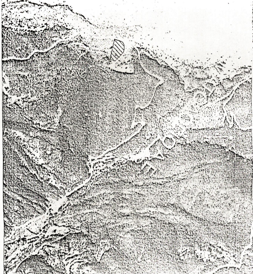
ΑΝΟΙΞΙΑ ΑΠΟ ΤΟ ΕΓΚΕΚΡΙΜΕΝΟ ΔΙΑΓΡΑΜΜΑ ΣΥΜΜ. ΔΙΑΜΟΡΦΗΣ ΕΤΟΥΣ 1960. ΚΑ. 1:5000