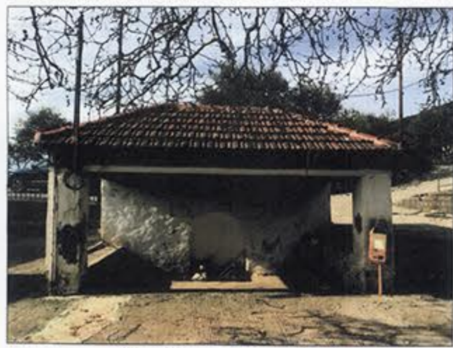
θέση λήψης φωτογραφίας 1