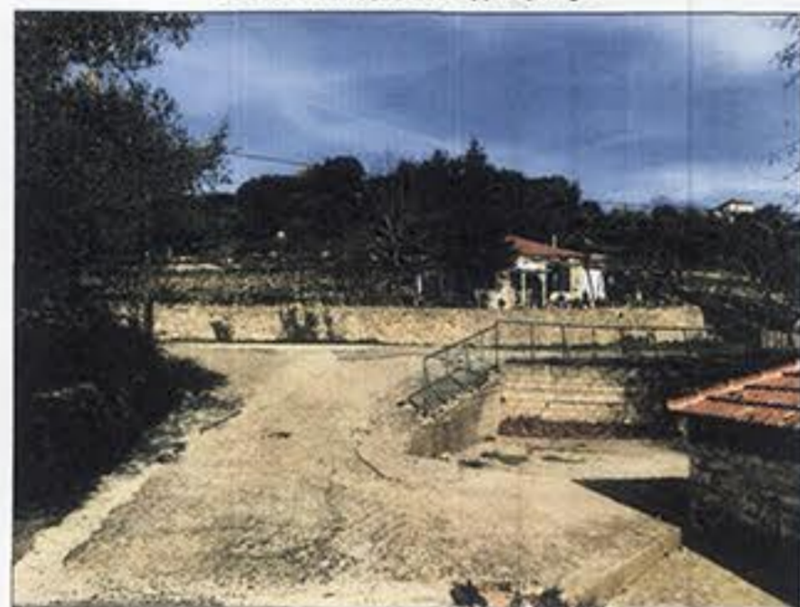
θέση λήψης φωτογραφίας 4