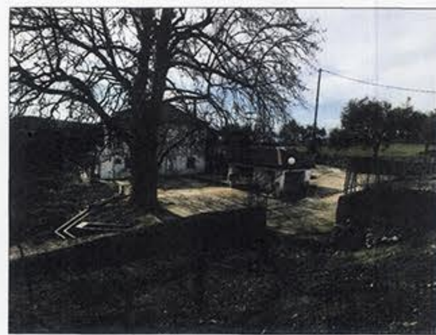
θέση λήψης φωτογραφίας 3