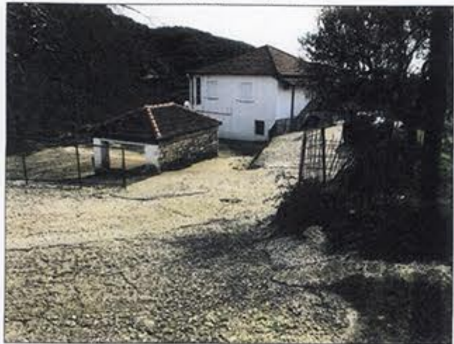
θέση λήψης φωτογραφίας 2