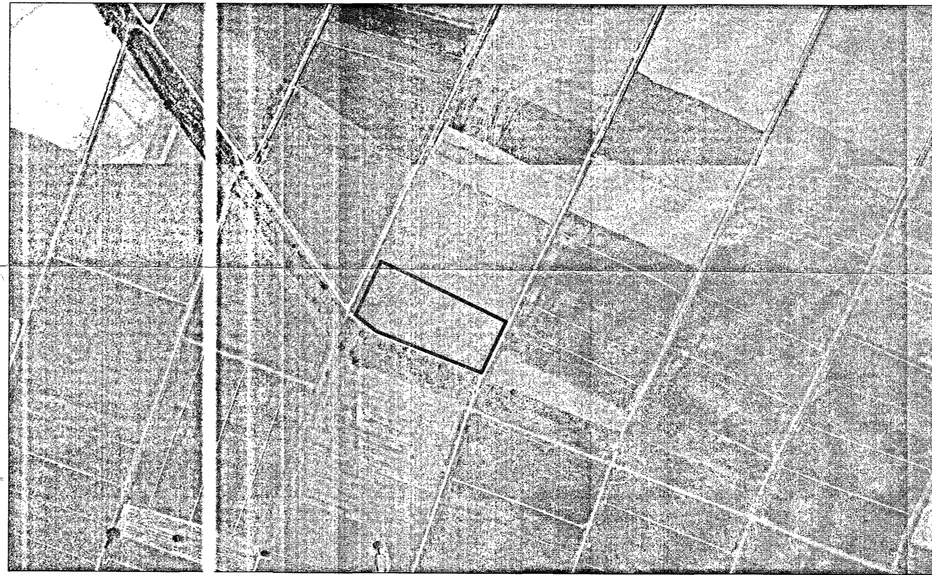
Θέση αγροτεμαχίου (Α1, Α2, Α3, Α4, Α5, Α1) σε απόσταση αεροφωτογράφων κλίμακας 1:5000