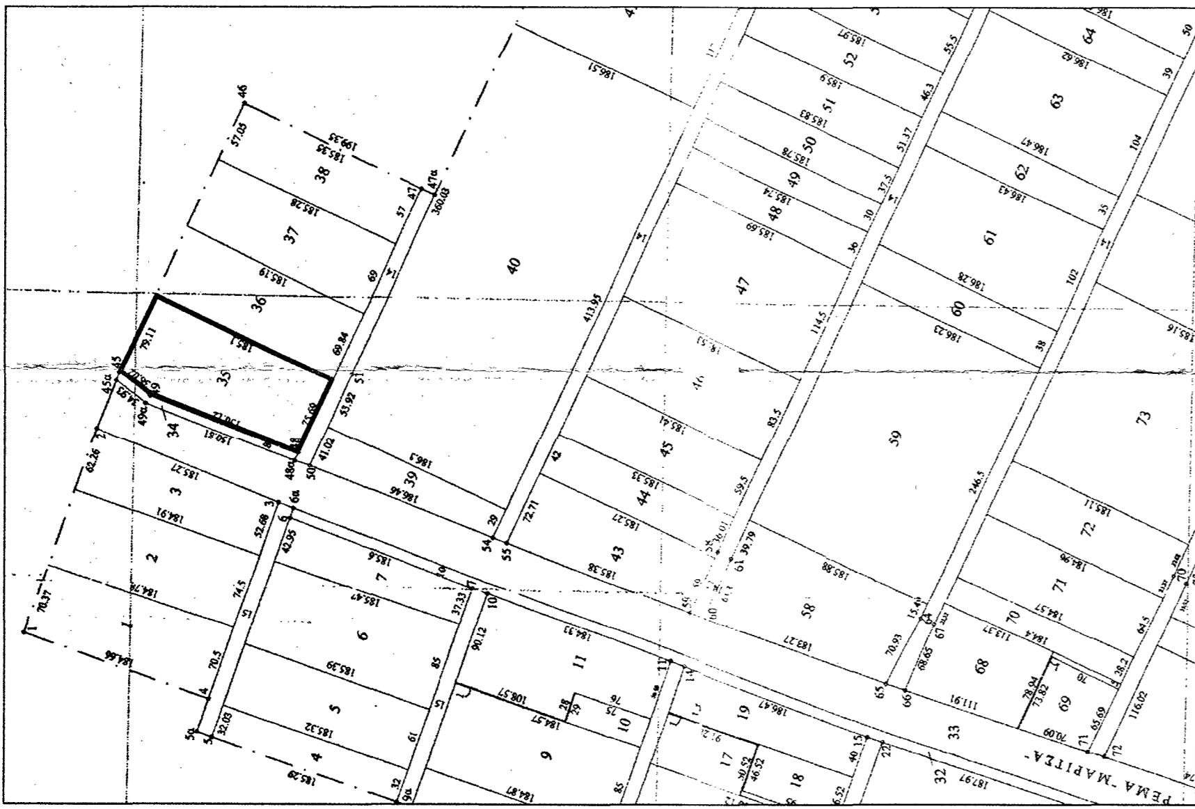
Θέση αγροτεμαχίου (Α1, Α2, Α3, Α4, Α5, Α1) σε απόσταση χάρτη αναδόχου αγροκτημάτων κάτω καλύτερης κλίμακας 1:5000.