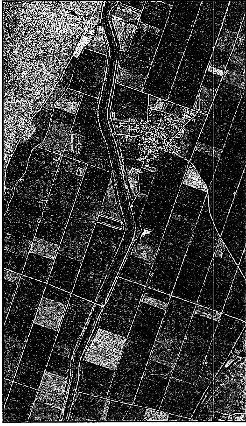
ΑΠΟΣΠΑΣΜΑ ΑΕΡΟΦΩΤΟΓΡΑΦΙΑΣ ΑΠΟ ΤΟ ΕΘΝΙΚΟ ΚΤΗΜΑΤΟΛΟΓΙΟ