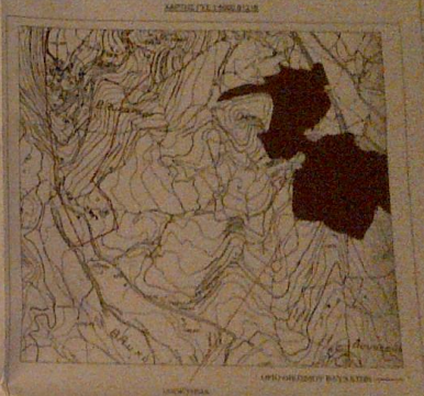
ΑΝΩΤΑΤΗ ΜΕΤΑΚΑΤΑΣΤΑΣΗ ΤΩΝ ΣΕΛ. 271

ΕΠΙΣΤΡΟΦΗ Ο κωδικός υποσημείωσης 870 είναι ο κωδικός υποσημείωσης που φαίνεται στην εικόνα, η οποία αποτελείται από 100 σημεία μετρήσεων και συνολικό μήκος περίπου 10,5 χιλιομέτρων. Η μετρήσιμη οδοού είναι η διαδρομή που φαίνεται στην εικόνα, η οποία αποτελείται από 100 σημεία μετρήσεων και συνολικό μήκος περίπου 10,5 χιλιομέτρων.