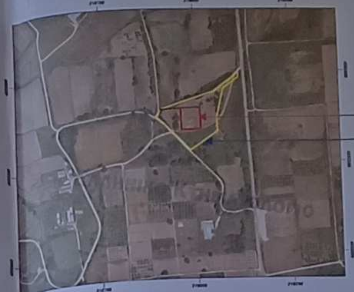
ΕΚΤΑΣΗ ΠΟΥ ΕΧΕΙ ΠΑΡΑΧΩΡΗΘΕΙ ΑΙΤΟΥΜΕΝΗ ΕΚΤΑΣΗ ΠΡΟΣ ΠΑΡΑΧΩΡΗΣΗ