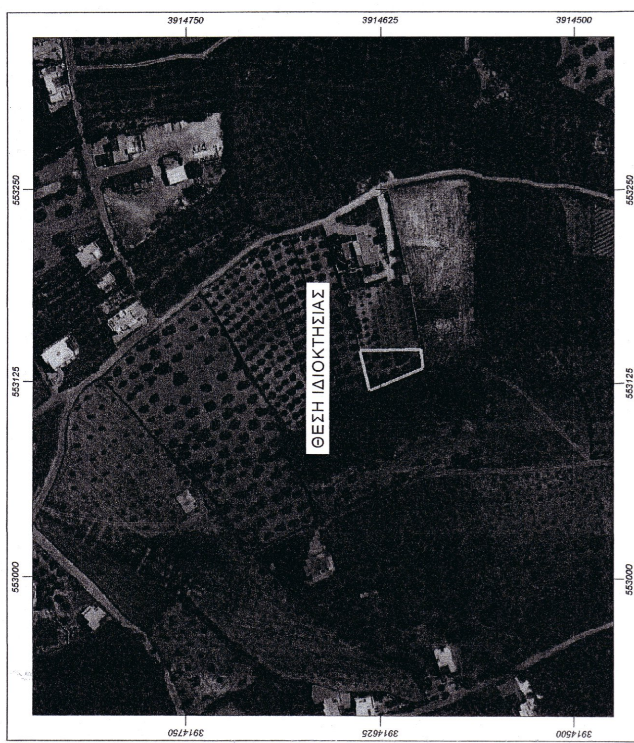
ΟΡΘΟΦΩΤΟΓΡΑΦΙΑ- ΟΔΟΙΠΟΡΙΚΟ ΣΚΑΡΙΦΗΜΑ

ΕΜΒΑΔΟΝ ΓΕΩΤΕΜΑΧΙΟΥ: Ε(1,2,3,4,5,6,1)=713,34τ.μ.