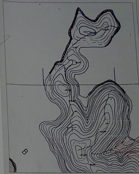
ΑΠΟΣΠΑΣΜΑ ΧΑΡΤΗ Γ.Υ.Σ. - ΚΛΙΜΑΚΑ 1:5.000

ΚΤΙΡΙΟΔΟΜΗΚΗ ΤΕΧΝΙΚΗ ΕΤΑΙΡΕΙΑ Α.Μ. Τ.Ε.Ε. 19137 ΚΑΡΑΒΕΛΑΣ ΛΕΥΚΑΔΑ ΤΗΛ. 248020011 ΕΜΒΛ. ΜΗΧΕΡΟΠΟΙΗΣΗ 1974-76 ΔΟΜ. ΚΑΤΑΣΚΕΥΕΣ ΣΤΕΦΑΝΟΣ ΚΑΡΑΒΕΛΑΣ ΑΔΑΡΧΗ ΕΠΕΡΙΧΕΙΡΕΙ ΤΗΝ ΕΤΑΙΡΕΙΑΝ ΙΩΑΝΝΗΣ ΛΙΒΙΤΖΑΝΟΣ ΠΟΛΙΤΙΚΟΣ ΜΗΧΑΝΙΚΟΣ