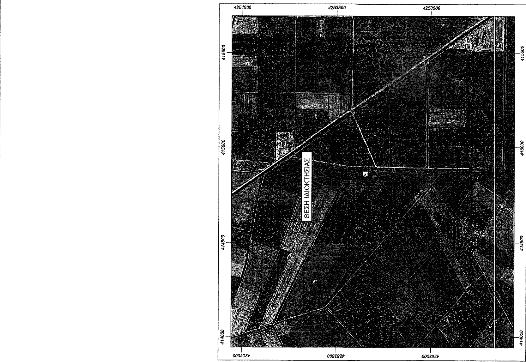
ΑΠΟΣΤΑΣΜΑ ΑΕΡΟΦΩΤΟΓΡΑΦΙΑΣ ΚΤΗΜΑΤΟΛΟΓΙΟΥ