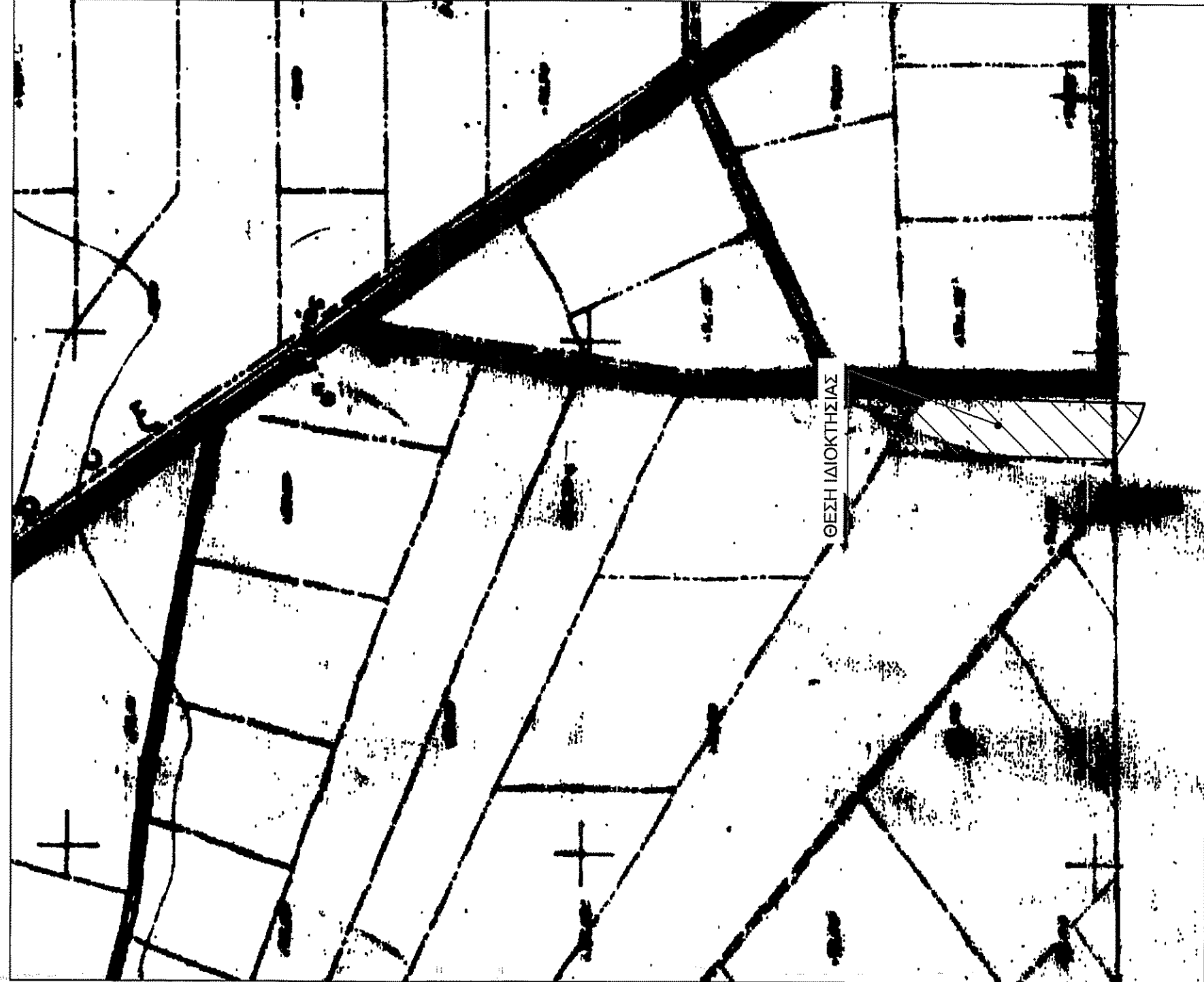
ΑΠΟΣΤΑΣΜΑ ΧΑΡΤΗ ΓΥΣ ΚΛΙΜΑΚΑ 1/5000 ΠΙΝ. 6308 - 5

Η εξόφληση στο Ε.Γ.Σ.Α. 87 καθώς και η αποτίμηση πραγματοποιήθηκε με την μέθοδο RT Kinematic κάνοντας κανόνες χρήση του σταθμού αναφοράς του GLONASS. Για τις μετρήσεις εξόφλησης και αποτίμησης χρησιμοποιήθηκαν δέκτες GPS διατης συχνότητας.