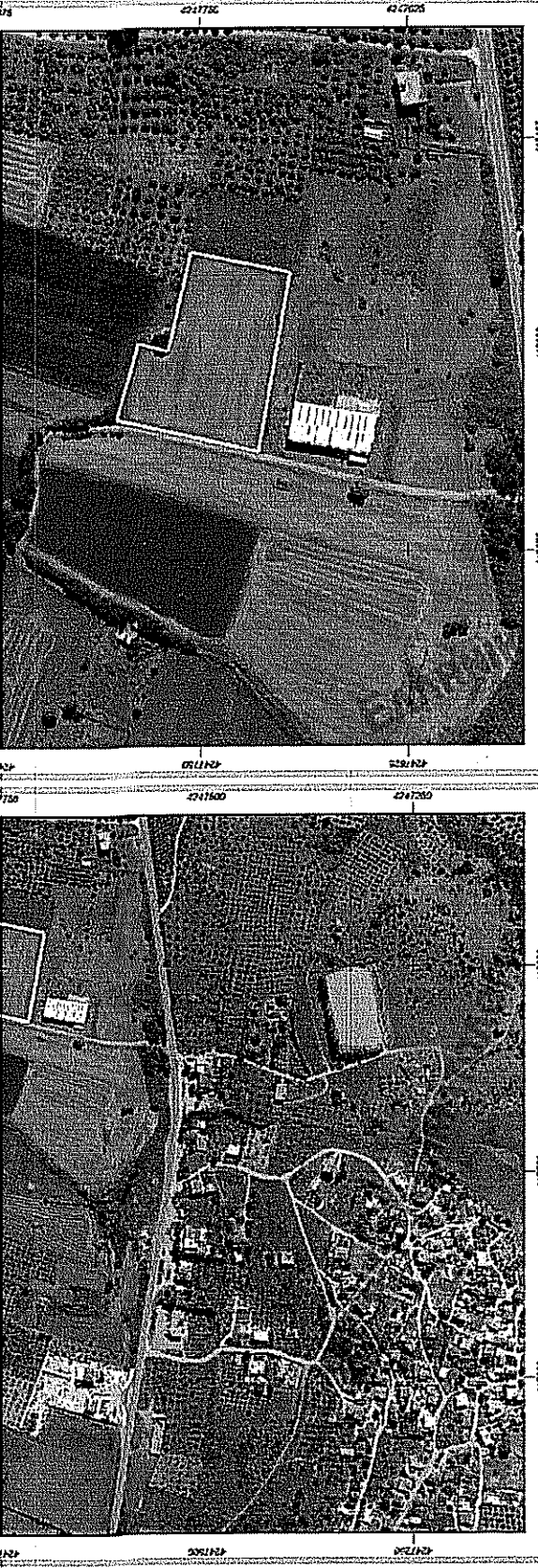
ΑΠΟΣΠΑΣΜΑ ΑΕΡΟΦΩΤΟΓΡΑΦΙΑΣ