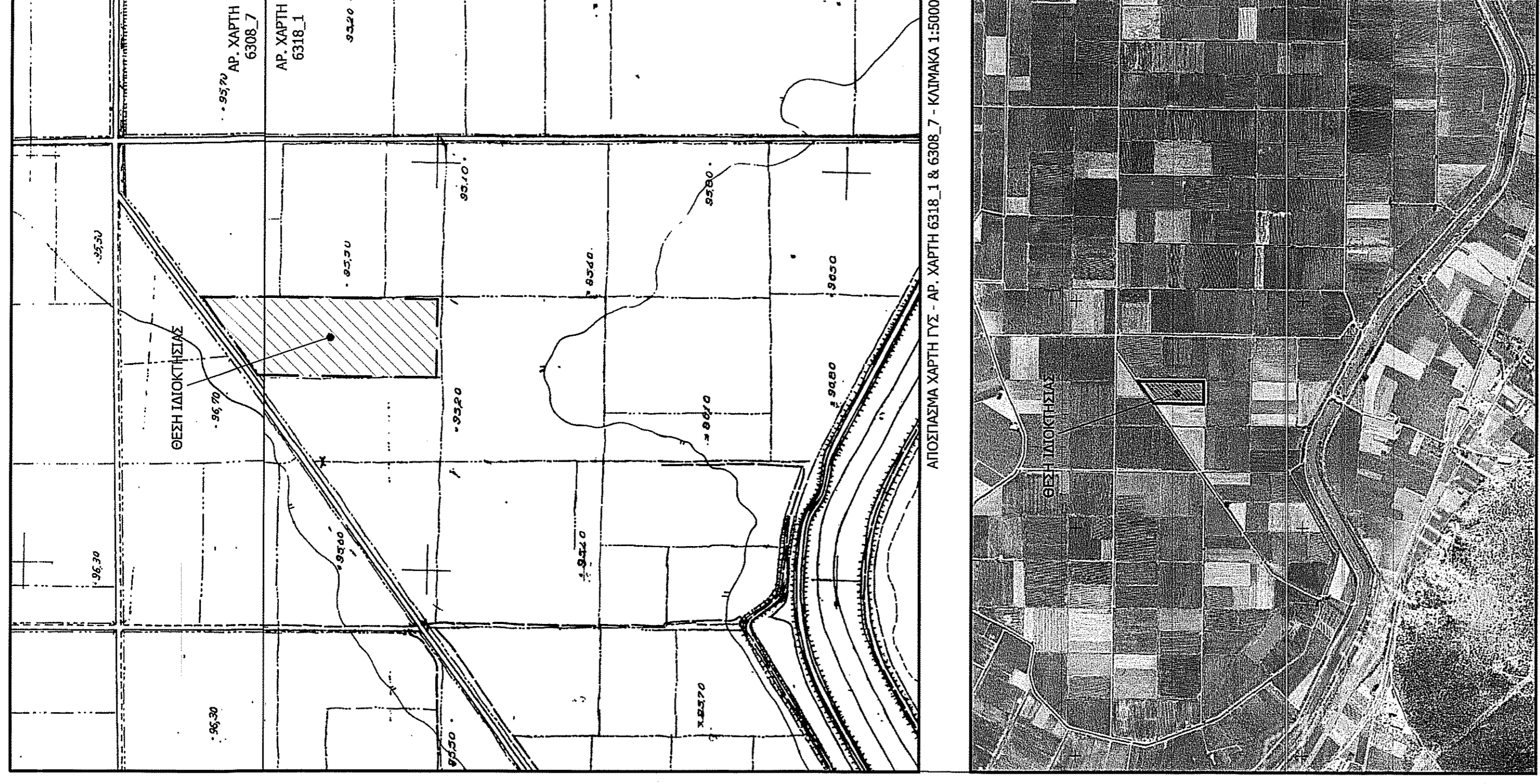
ΑΠΟΣΤΑΣΙΑ ΑΕΡΟΦΩΤΟΓΡΑΦΙΑΣ ΑΠΟ ΤΟ ΕΘΝΙΚΟ ΚΤΗΝΟΠΟΙΣΤΕΙΟ

ΟΡΟΙ ΔΟΜΗΣΗΣ ΕΚΤΟΣ ΟΡΙΩΝ ΟΙΚΟΔΟΜΗΣ (Π.Δ. 26.05.1985 - ΘΕΚ 2704 / 31.05.1985 & Ν. 3212 - ΘΕΚ 3084 / 31.12.2003 - ΘΕΚ 4564/31-12-2012.) Αρμόδια κατά κανόνα: (με πρόταση σε κοινόχρηστο δρόμο) Εμβαδόν = 400τμ - Πρόσκαμα = 25.00μ (με πρόταση σε δημόσιο δρόμο και σε ενοικιαζόμενα τμήματα τους και σε ενοικιαζόμενα γκαράζ) Εμβαδόν = 2000τμ - Πρόσκαμα = 35.00μ - Βάθος = 40.00μ (πρό 17.10.1978) Εμβαδόν = 1200τμ - Πρόσκαμα = 20.00μ - Βάθος = 35.00μ (πρό 12.09.1964) Εμβαδόν = 750τμ - Πρόσκαμα = 10.00μ - Βάθος = 15.00μ (πρό 12.11.1962) (στης της όλης έκτασης και εκκαμίας ή πρό 24.04.1977) Εμβαδόν = 200τμ