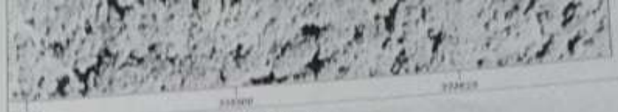
ΑΠΟΞΕΠΑΣΜΑ ΟΡΟΦΟΤΟΧΑΡΤΗ ΚΤΗΜΑΤΟΛΟΓΙΟΥ 1:2.000