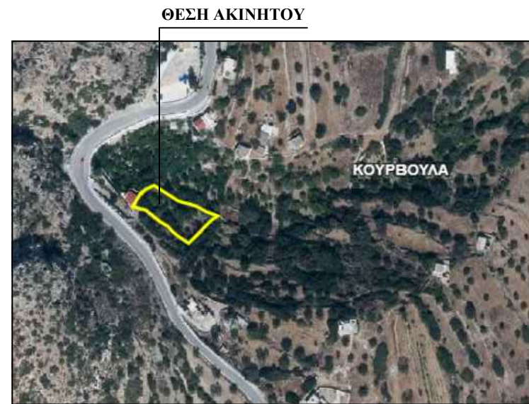
ΑΠΟΣΠΑΣΜΑ ΧΑΡΤΗ http://gis.ktimanet.gr/