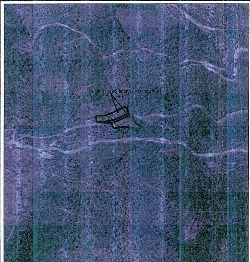
ΑΠΟΣΠΑΣΜΑ Ορθοφωτοχάρτη (Κτηματολογίου) ΚΛΙΜΑΚΑ 1: 5000

Το υπο στοιχεία (Α,Β,Γ,....,Ν,Ξ,Ο,Α) γήπεδο I εμβαδού 1793.30 μ² τυγχάνει άρτιο και οικοδομήσιμο κατά παρέκκλιση εφόσον προϋφίσταται ως έχει του έτους 1962. Το υπό στοιχεία (α,β,γ,....,μ,ν,ξ,α) γήπεδο II εμβαδού 1783.78 μ² τυγχάνει άρτιο και οικοδομήσιμο κατά παρέκκλιση εφόσον προϋφίσταται ως έχει του έτους 1962. Τα όρια υπεδείχθησαν από τον Μανωλόπουλο Γεώργιο. Δεν ευρίσκονται εντός αρχαιολογικού χώρου. Δεν ευρίσκονται εντός σχεδίου ή επεκτάσεως πόλεως. Δεν συνέχονται με άλλη έκταση του ίδιου ιδιοκτήτη. Ευρίσκονται εκτός οικισμού Παλαιοκάστρου Τ.Κ. Σαρακινίου, Δ.Ε. Γόρτυνος, Δήμος Μεγαλόπολης. Εξάρτηση από το υπάρχον τριγωνομετρικό δίκτυο με gps Stonex S9 III. Εντός των γηπέδων υπάρχουν ελαιόδενδρα. Εντός των γηπέδων δεν διέρχεται γραμμή υψηλής τάσης. Ο Δήμος Μεγαλόπολης έχει κυρηχθεί υπό κτηματογράφηση και έχει ξεκινήσει η διαδικασία υποβολής δηλώσεων ιδιοκτησίας. Τα εμβαδά υπολογίστηκαν από τις συντεταγμένες των κορυφών. Τα ακίνητα ευρίσκονται εκτός δασικής ανάρτησης σύμφωνα με τον αναρτημένο δασικό χάρτη όπως έχει μερικώς κυρωθεί με το ΦΕΚ33Δ/2018 Δεν οφείλεται εισφορά σε γή και χρήμα σύμφωνα με το Ν. 1337 / 83.