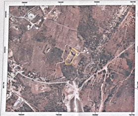
ΑΓΟΣΠΑΣΜΑ ΧΑΡΤΗ ΑΓΡΙΟ ΚΥΜΑΤΟΛΟΓΙΟ Α.Ε. (http://grio.kymatoloi.gr/wms/ktismasmap/default.asp)