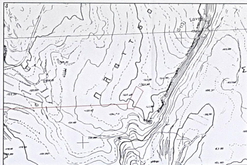
ΑΓΟΣΠΑΣΜΑ ΧΑΡΤΗ ΓΥΣ ΚΑΜΑΚΑ 1:5000