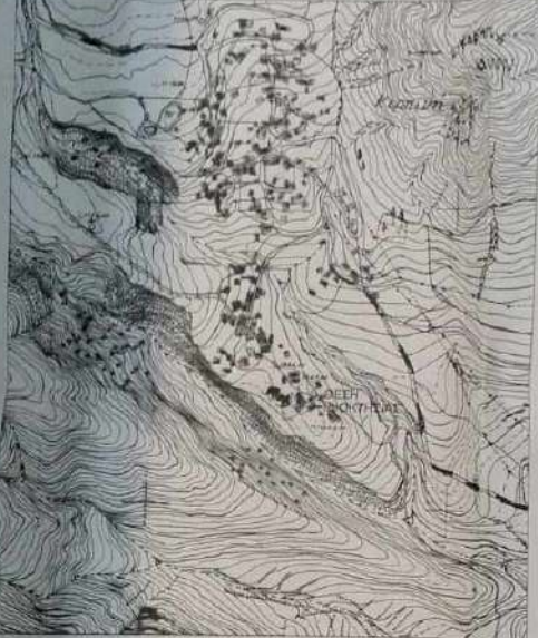
ΑΠΟΣΠΑΣΜΑ ΚΥΡΩΜΕΝΟΥ ΔΑΣΙΚΟΥ ΧΑΡΤΗ